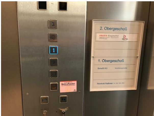
Eingang 1. Etage: