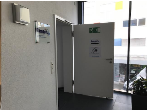
Beschilderung der Jugendzahnpflege: